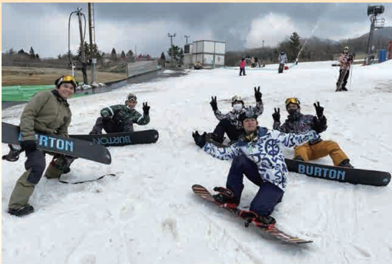
JITCOホームページの「技能実習Days」から1枚を選んで掲載しています。(裏表紙に応募要項)

しんがたころなういるす りゅうこう ぎょうじ ざくとう かんせんたいさく おお 新型コロナウイルスの流行でなかなか行事などができませんでしたが、昨冬に感染対策をとりながら大 いたけんない すきーじょう い いんどねしあじん ぎのうじっしゅうせい ぼこく たいけん ゆき かん 分県内のスキー場に行ってきました。インドネシア人の技能実習生たちは母国では体験できない雪に感 動して、楽しい一日を過ごしました。(三井E&Sマシナリー)