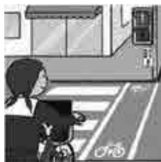
မီးပွိုင့်အချက်ပြမှုကို လိုက်နာပါ