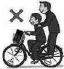
နှစ်ယောက်မစီးရ